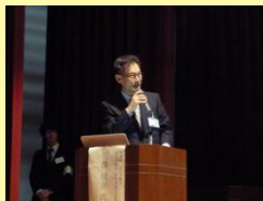
若者の就労事情の紹介

第2部の学校連携事業に関するパネルディスカッションでは、地域人材を活用した各学校での取り組みが紹介されました。その中で見えてきた課題を今後どのように改善していくのか、またサポステとどのように関わっていくのかなど、いろいろなご意見をいただきました。